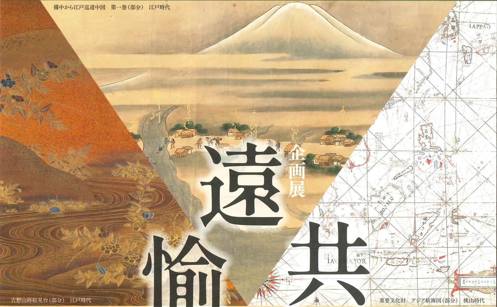
吉野山蔭絵見台(部分) 江戸時代