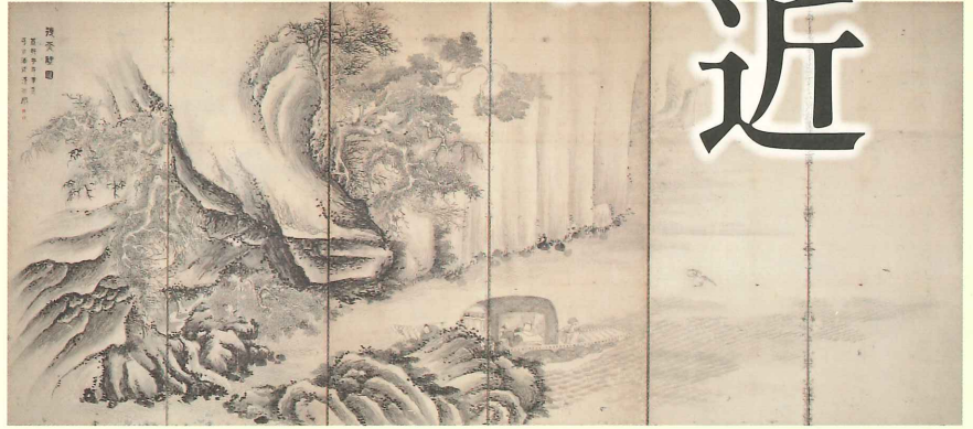
岡山県指定重要文化財 前赤壁・後赤壁図屏風(左隻) 彭城百川筆 江戸時代