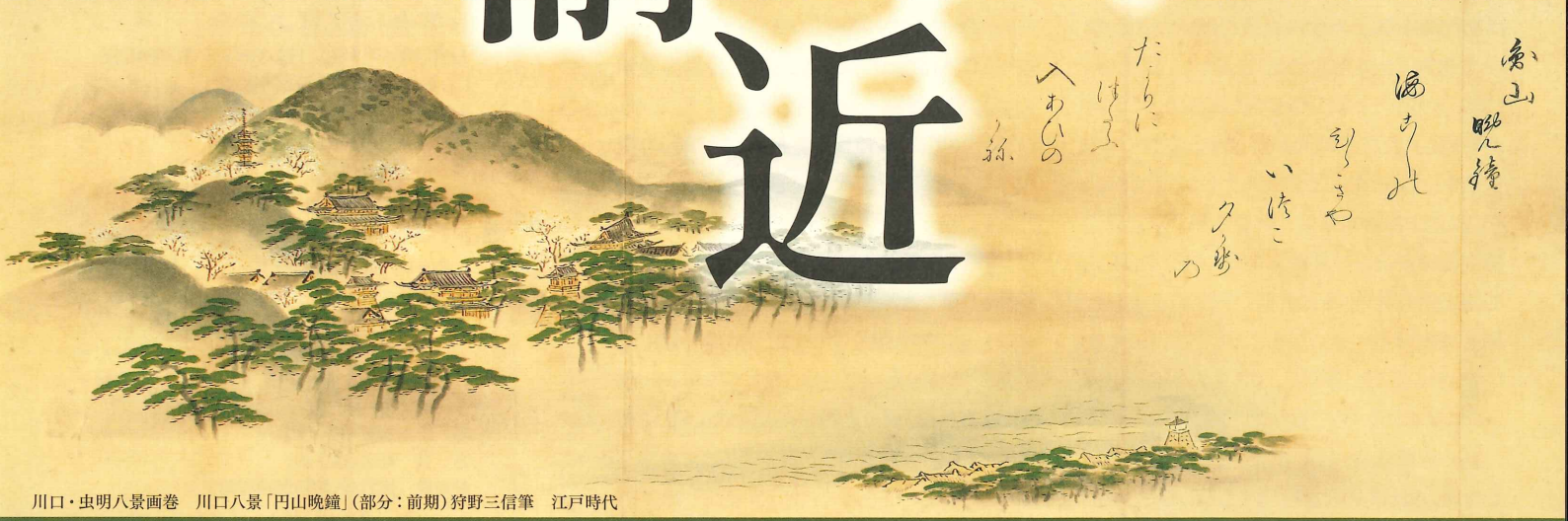
川口・虫明八景画卷 川口八景「円山晚鐘」(部分:前期)狩野三信筆 江戸時代