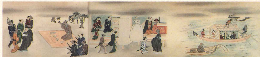
初公開 狐之絵(部分) 池田綱政筆 江戸時代