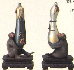
猿猴置物 正阿弥勝義作 明治時代

各作品の「お題」は、前期(7月10日～8月8日)・後期(8月10日～9月5日)に分け、半分ずつ出題いたします。