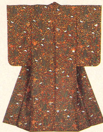
松竹鶴亀宝尽文様腰巻 池田宇多子所用 江戸時代