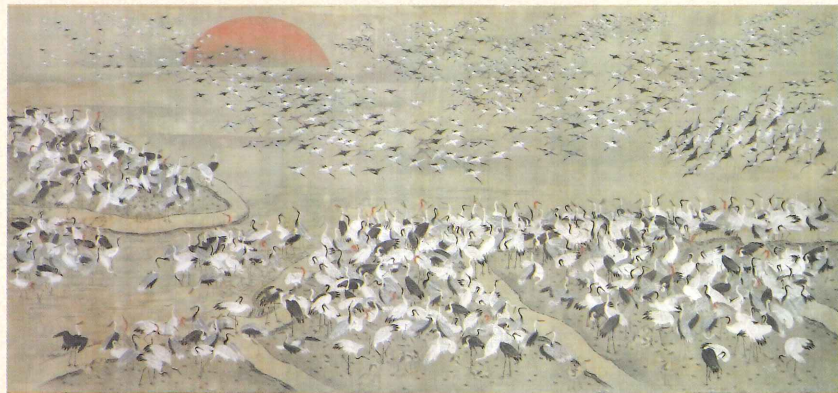
千羽鶴図 長谷川常雄筆 江戸時代