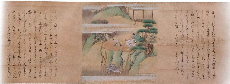
平家物語絵巻 巻第二(下) 新大納言の死去の事(部分) 土佐左助筆 江戸時代

こうした展示品を通じて、人間の業や日本人の死生観をご覧いただけますと共に、暑さをしのぐひと時をお過ごしください。