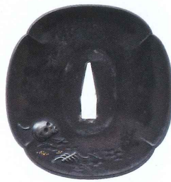
鰐野晒し・表 江戸時代 個人蔵