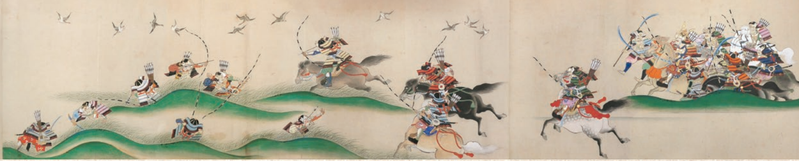
『奥州後三年記絵巻』 雁行の乱れ(部分) 狩野自得筆 江戸時代

当館では2023年から2025年にかけて新たに20口の刀剣類を収蔵いたしました。この度これらの調査を終え、本展にて新収蔵刀剣を初公開いたします。「刀 銘 備中国三村修理進源朝臣元親 冬広作」は、備中国の戦国武将・三村元親が若狭国出身の刀鍛冶・冬広に作らせた刀剣です。他に備中国守護代を務め、備中国高山城(幸山城)主とされる石川幸久自らが製作した刀剣など、戦国武将をはじめとしたサムライたちと刀鍛冶との関係を物語る貴重な作品群です。