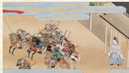
『平家物語絵巻』巻第七下 忠度都落(部分) 江戸時代

これらの作品が語りかける物語に耳を傾けることで、サムライたちが生きた時代の息吹と、そこに込められた美の再発見になれば幸いです。